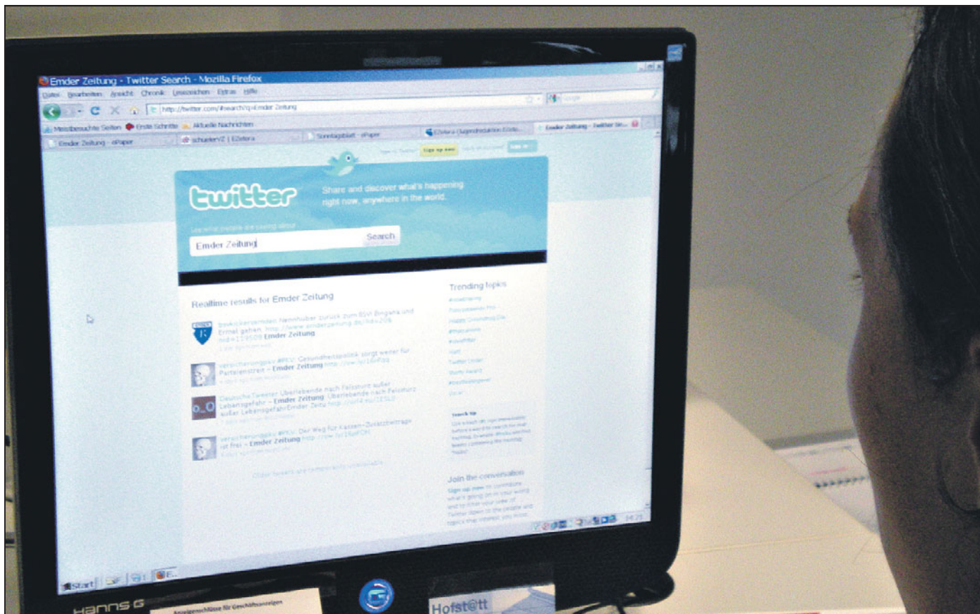
„Twittern“ nennen sich die kleinen Plaudereien, die über Handy, Computer und Internet geführt werden. Doch diese neue Methode der Kommunikation könnte durchaus einen Nutzen für die Wirtschaft haben.

Die Möglichkeit des „twittern“ nutzen im Wellnesshotel „Vitalis“ 15 Gäste aus der Tourismus- und Hotelbranche, um sich einen Einblick in die „sozialen Netzwerke“ im Internet zu verschaffen. Referent Torsten Friedrich warf die Frage auf, wie in der Tourismusbranche das Medium Internet im Hinblick auf das „twittern“ zu nutzen ist. Dabei wurden auch die Plattformen